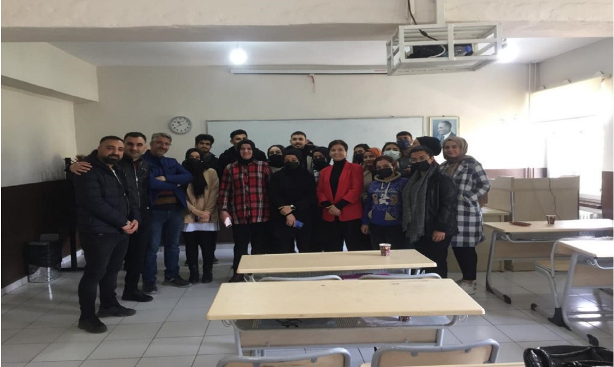
Mezunlarımızla buluşma etkinliği