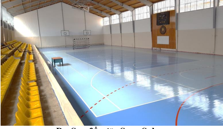
Dr. Şeref İnalöz Spor Salonu