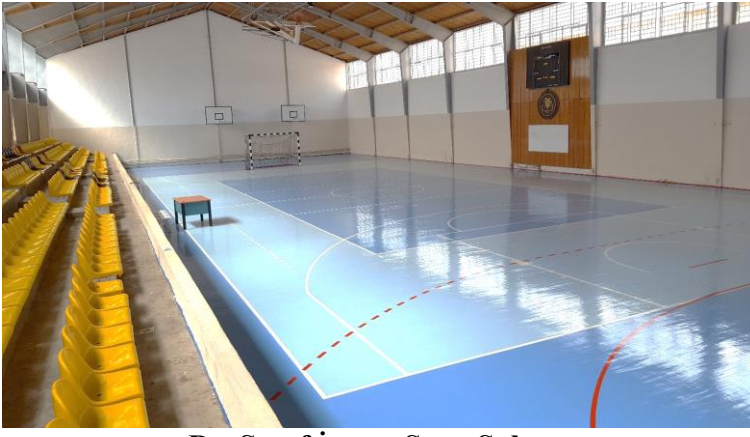
Dr. Şeref İnalöz Spor Salonu