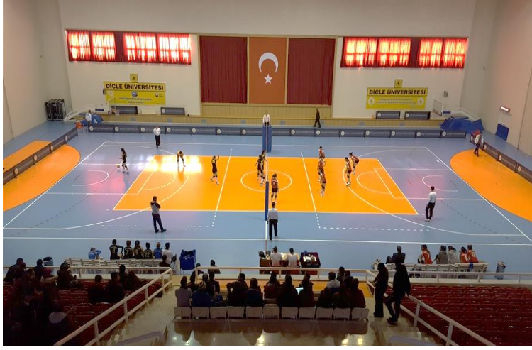
Büyük Spor Salonu