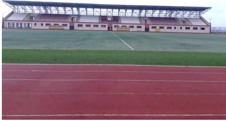
Spor Adası Futbol Sahası