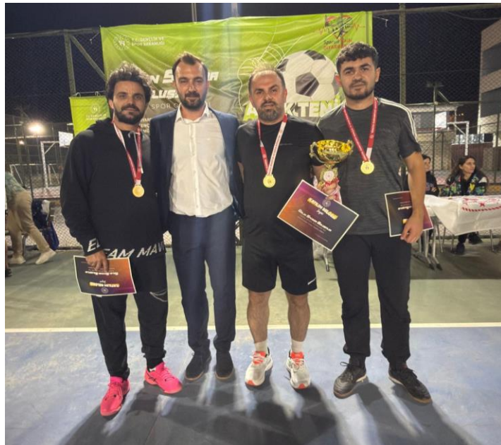
Ayak Tenisi Turnuvasında BESYO Şampiyon