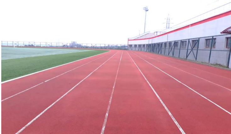
Spor Adası Atletizm Pisti