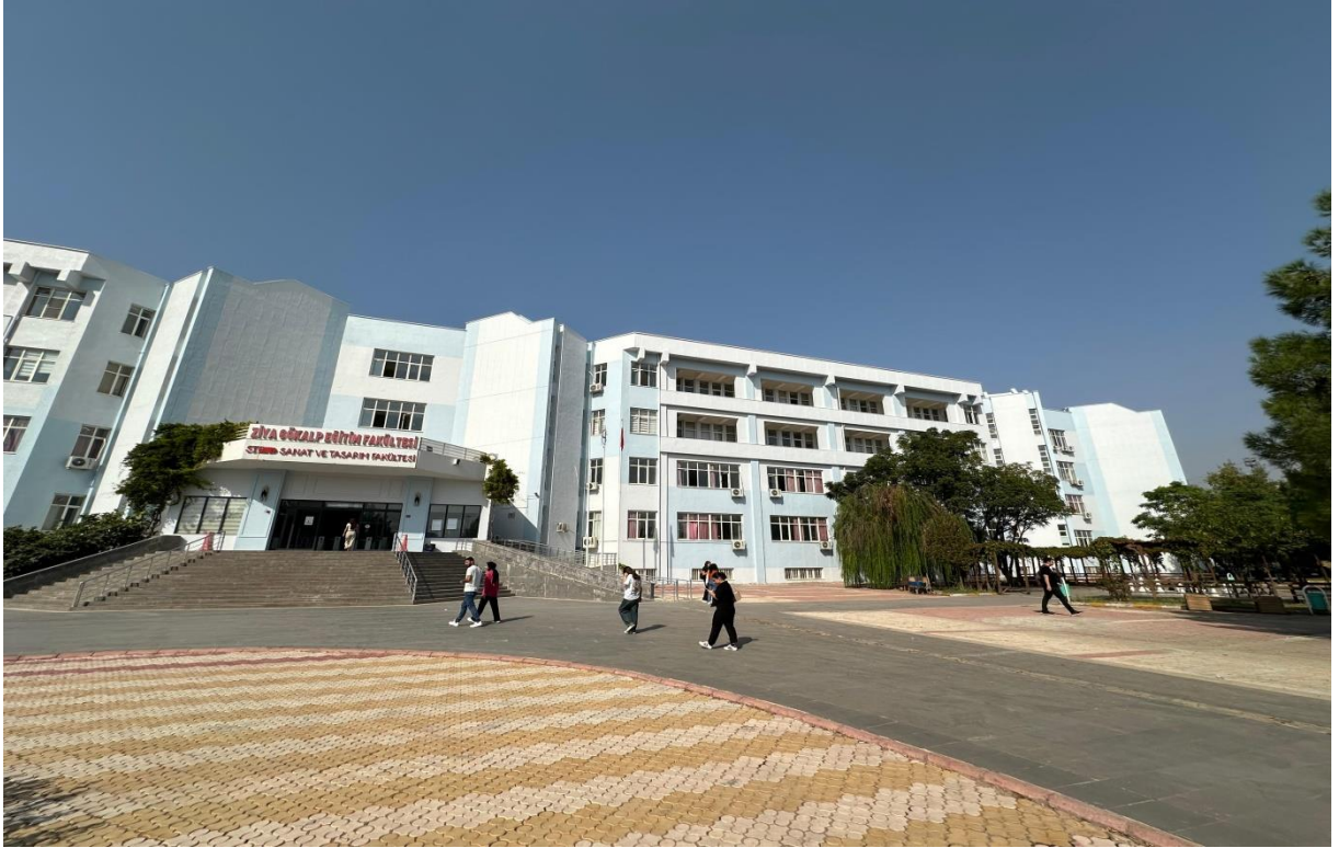
Fakültemiz Binasının güçlendirme işlemlerinden sonraki hali.