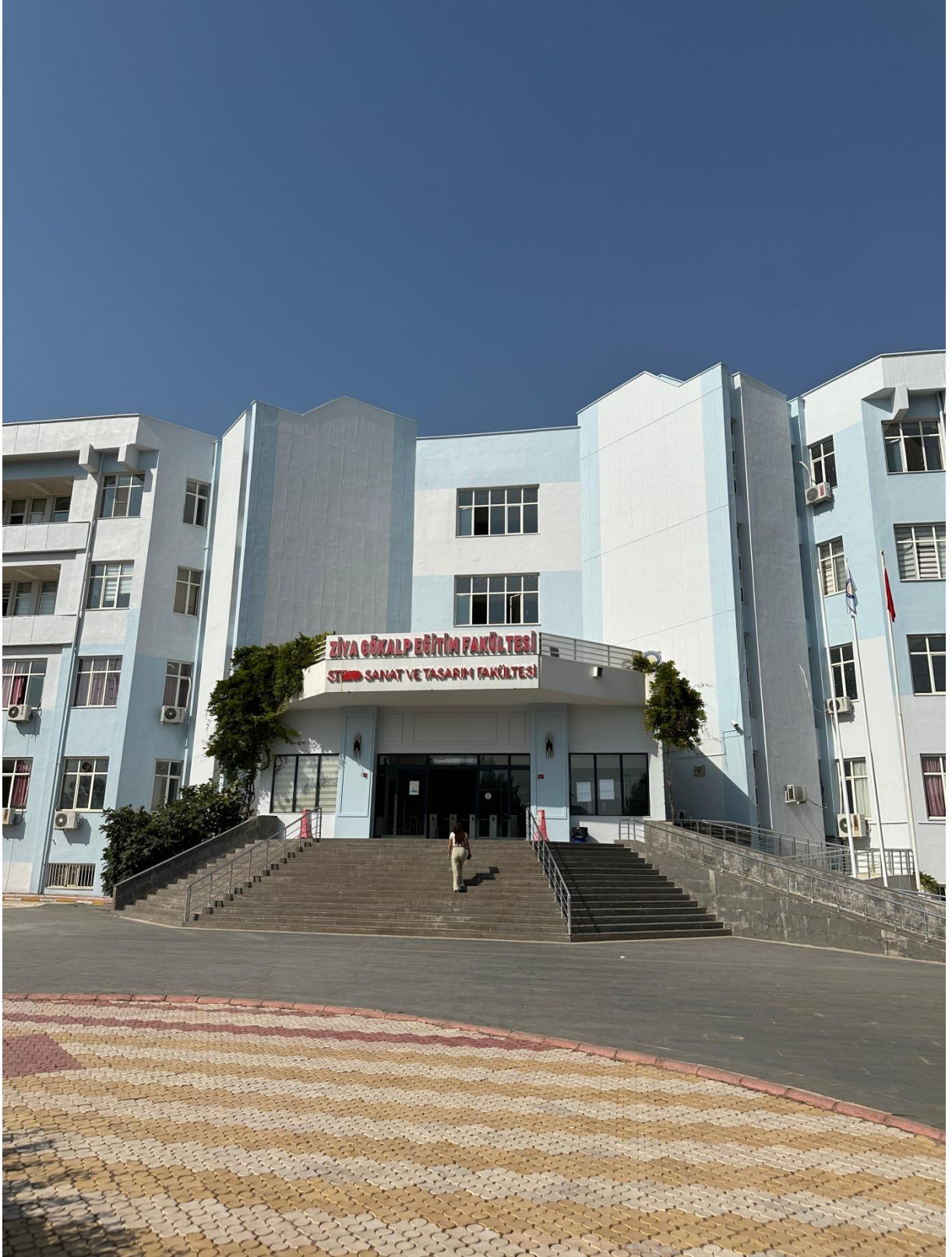
Fakültemiz Binasının güçlendirme işlemlerinden sonraki hali.