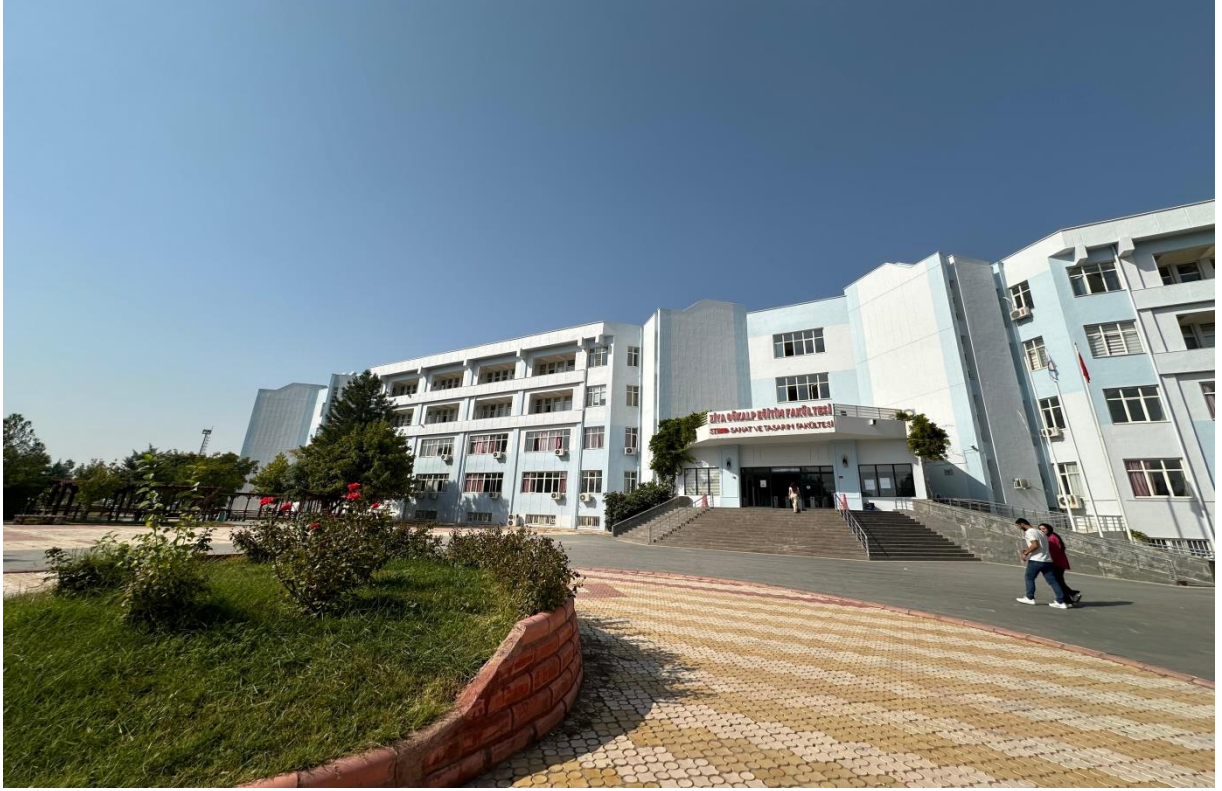
Fakültemiz Binasının güçlendirme işlemlerinden sonraki hali.