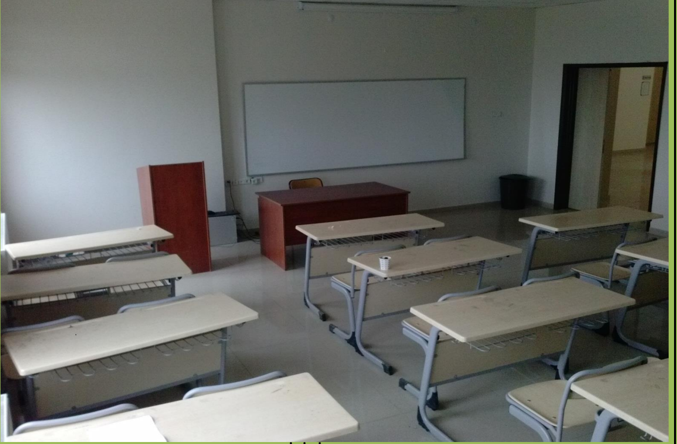
30 KİŞİLİK SINIFIMIZ