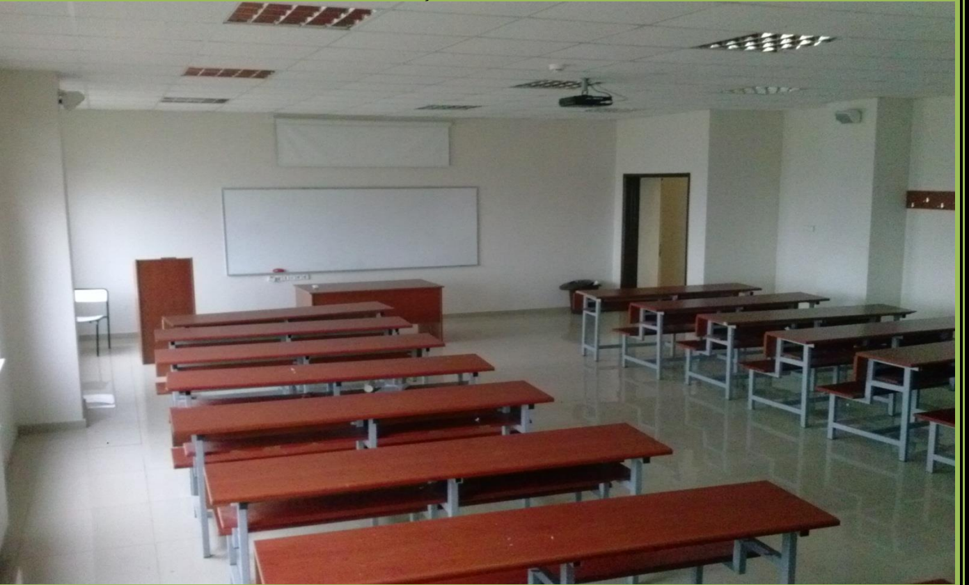
60 KİŞİLİK SINIFIMIZ