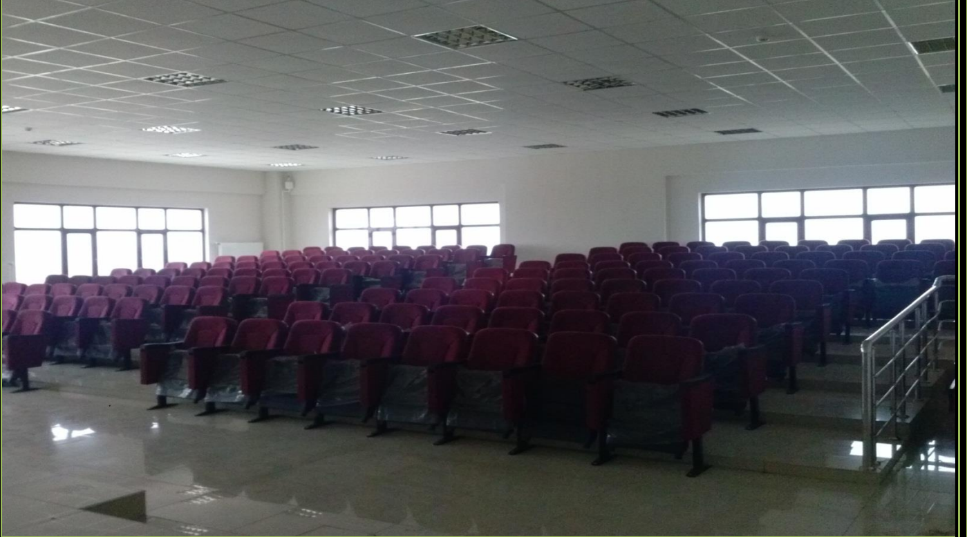
165 KİŞİLİK ANFİMİZ VE KONFERANS SALONUMUZ