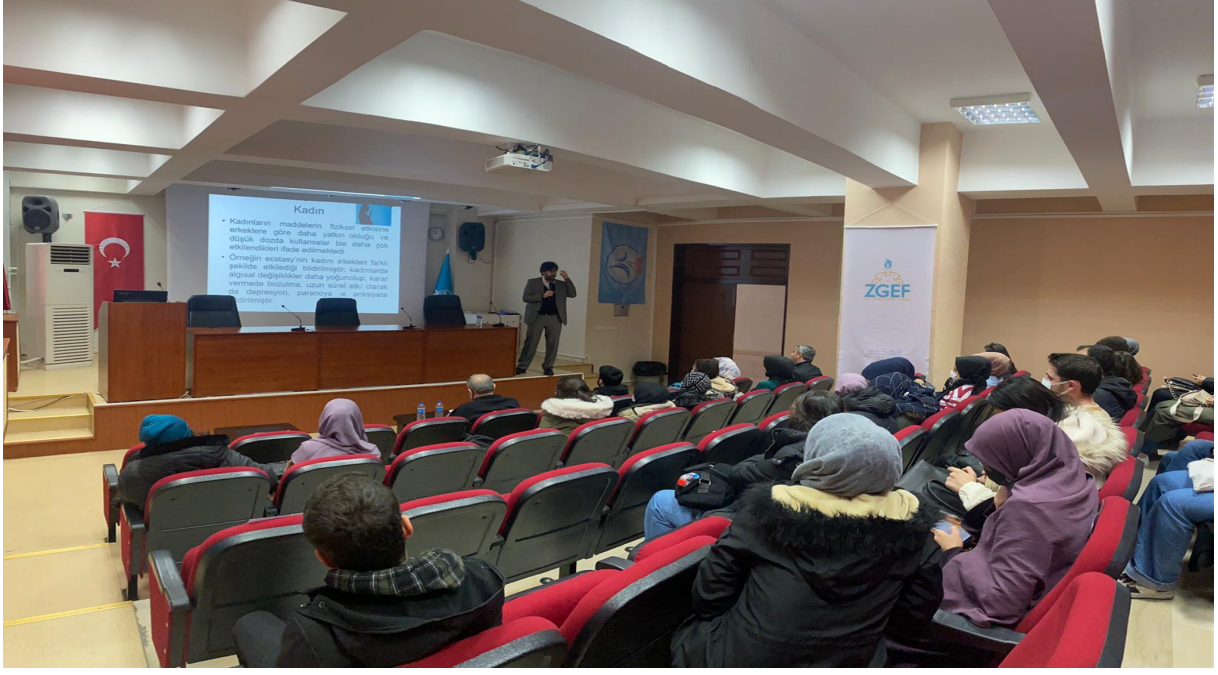
Ziya Gökalp Eğitim Fakültesi Konferans Salonunda düzenlenen seminer, soru ve cevaplarla son buldu.