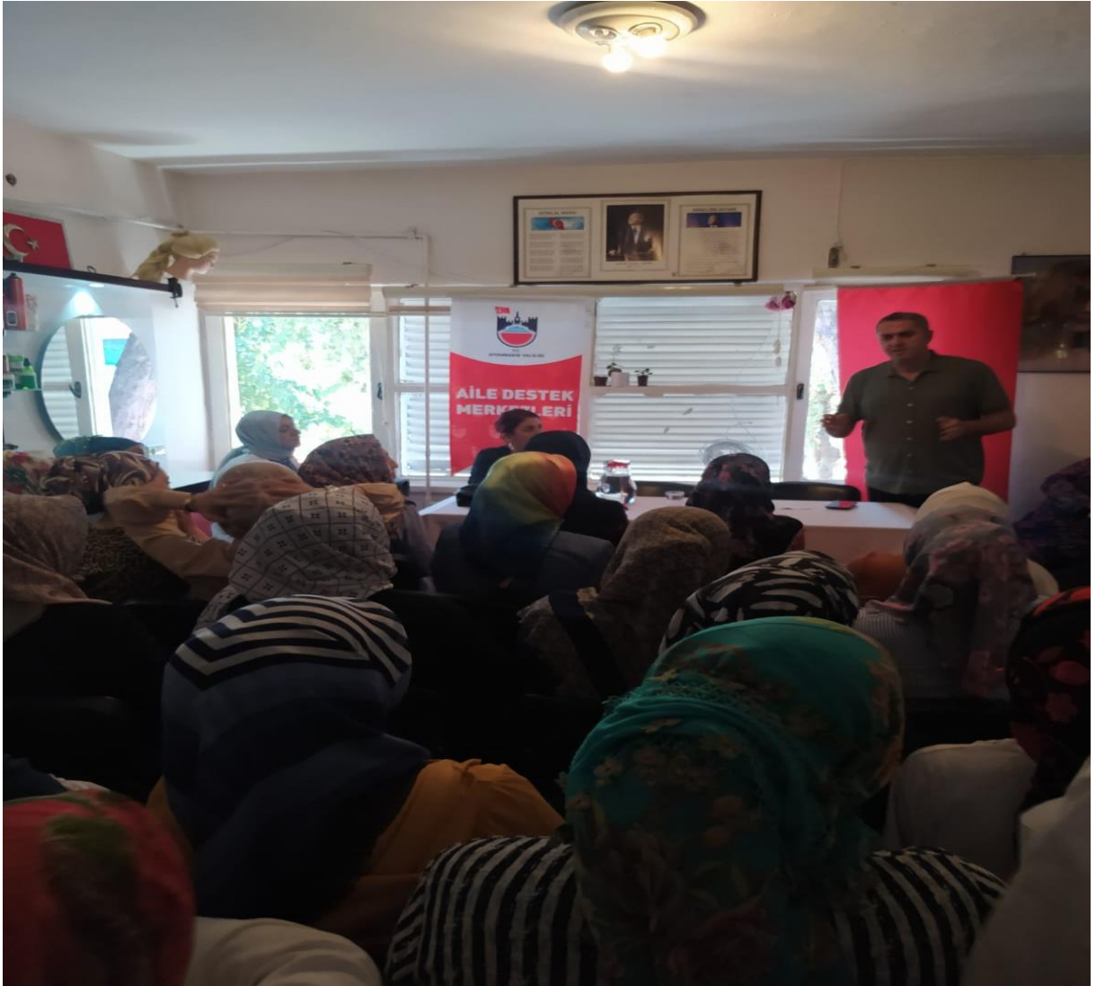
20.07.2023 tarihinde yapıldı.