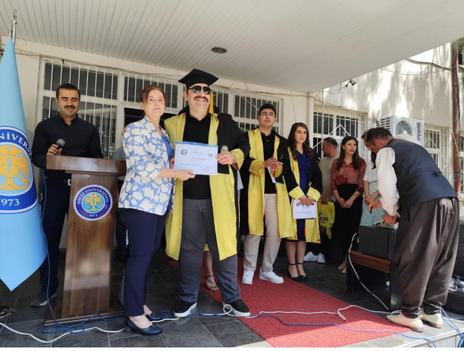
Her yıl mezun olan öğrencilerimize tören düzenlenmektedir.