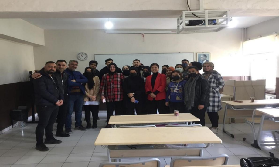
Mezunlarımızla buluşma etkinliği