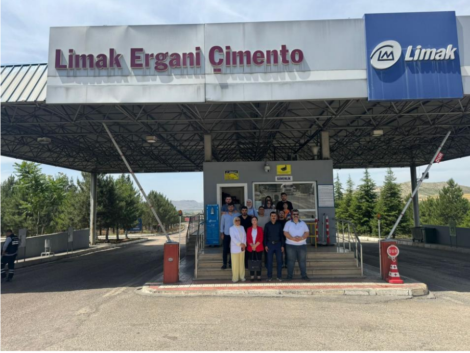
Programımızda işlenen dersler kapsamında iş yeri gezileri yapılmaktadır.