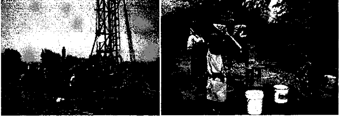
Şekil 2: Su sıkıntısının çok ciddi boyutlara ulaştığı, binlerce insanın temiz suya ulaşamadığı, kişi başı su kullanımının dünya ortalamasının dörtte biri olduğu Afrika'da DSİ tarafından yapılan çalışmalarla, kıta ülkelerine içme ve kullanma suyu ulaştırılmış olup bu sayede DSİ hizmetlerini ülke sınırları dışında da sürdürmektedir.

Çeşitli kullanım amaçlarına yönelik tahsis edilen yeraltısuyu miktarı 17,03 milyar m 3 tür. Bu miktarın %67 si sulama, % 24 ü içme-kullanma ve % 9 u sanayi amaçlı olarak tahsis edilmiştir.