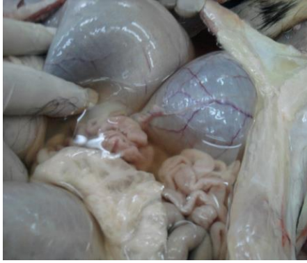
Şekil 3. Karın boşluğunda sıvı birikimi