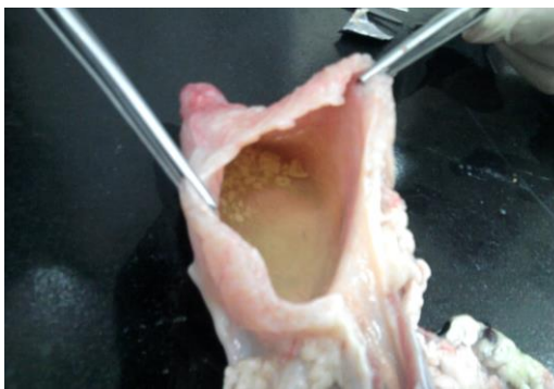
Şekil 5. İdrar kesesindeki taşlar

İdrar kesesinin aşırı dolgun, duvarının ince ve şeffaf görünümde ve damarlarının aşırı konjesyone olduğu gözlemlendi (şekil 4). Daha sonra idrar kesesi açıldı ve içerisinde irili ufaklı çok sayıda beyaz kireç benzeri yabancı cisimlerle karşılaşıldı (şekil 5). Prostat bezine kadar sadece dilatasyon şekillenen bir üretra var iken, prostat bezinin bulunduğu kısımdan itibaren üretra mukozası yer yer hiperemik ve ödemliydi (şekil 6).