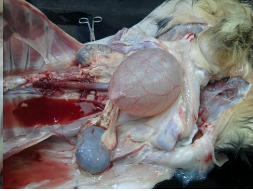
Şekil 4. Dolgun idrar kesesi

İdrar kesesinin aşırı dolgun, duvarının ince ve şeffaf görünümde ve damarlarının aşırı konjesyone olduğu gözlemlendi (şekil 4). Daha sonra idrar kesesi açıldı ve içerisinde irili ufaklı çok sayıda beyaz kireç benzeri yabancı cisimlerle karşılaşıldı (şekil 5). Prostat bezine kadar sadece dilatasyon şekillenen bir üretra var iken, prostat bezinin bulunduğu kısımdan itibaren üretra mukozası yer yer hiperemik ve ödemliydi (şekil 6).