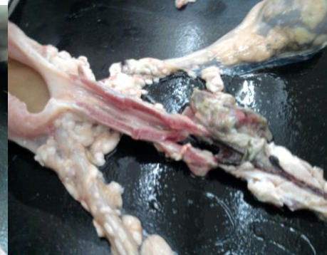
Şekil 6. Prostatın önünde ürolite bağlı yangı

Prostat bezinin hemen önünde üretral geçişin bir ürolit tarafından tamamen tıklandığı görüldü. Tıkanmanın olduğu kısımda hemorajik alanlar tespit edildi. Prostat bezinde orta derecede büyüme, yangı ve hiperemik bir görünüm saptandı. Tıkanmanın olduğu noktadan sonraki kısımlar normal görünümde