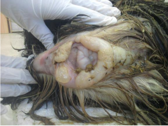
Şekil 1. Anal bölgede ödem